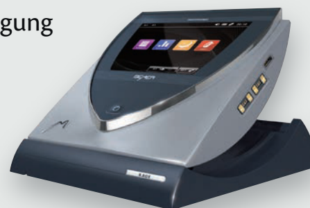
B.BOX Professional Weltweite Patente!